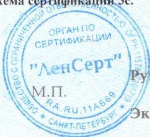
Схема сертификации Зс.